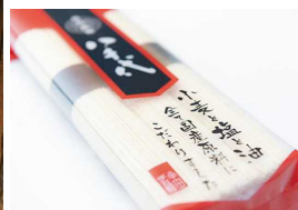
半田手延べそうめん