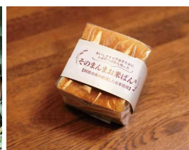
そのまんまお米パン