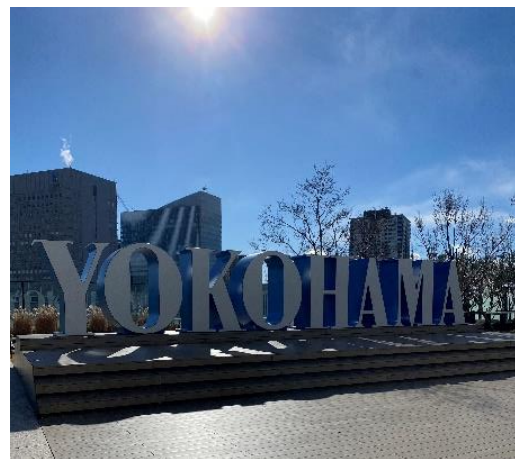
JR 横浜タワー12F 屋上広場 うみそらデッキ