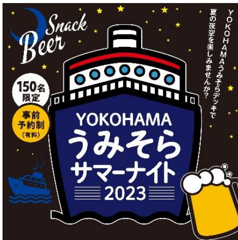
「YOKOHAMA うみそらサマーナイト」キービジュアル

本企画を通じ、多くのお客さまに YOKOHAMA Station City や横浜エリアの魅力に触れていただきたいと考えております。