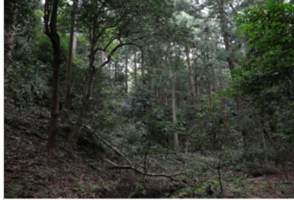
竹野神社 神域 | Takano Shrine, sacred forest