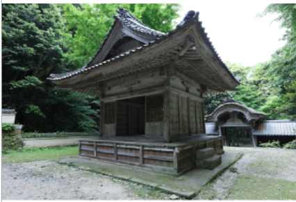
竹野神社 拝殿、写真：森川昇 | Takano Shrine, worship hall, Photo: Noboru Morikawa