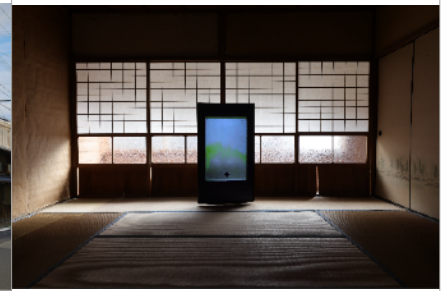
サムソン・ヤン「Reasonable music (Lyrica)」2022年、写真：森川昇 | Samson Young “Reasonable music (Lyrica)”, 2022, Photo: Noboru Morikawa