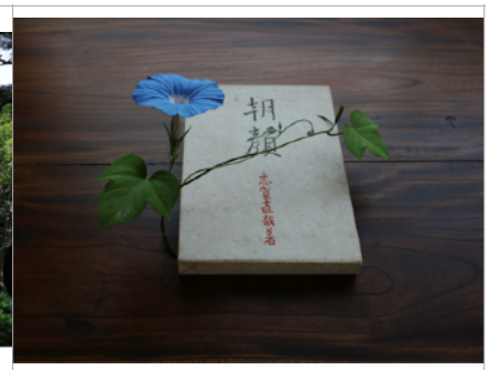
須田悦弘「朝顔」2022年、写真：須田悦 弘 | Yoshihiro Suda “Morning glory” 2022, Photo: Yoshihiro Suda