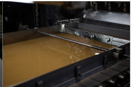
間人紙の制作風景 Production of Taiza paper