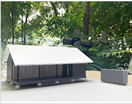
左からレジデンス案、右に《【食の祭】のための納屋》（設計：西沢立衛） | Cabin (to be built in future) on left and store house by Ryue Nishizawa