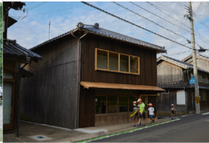
間人スタジオ、写真：森川昇 | Taiza Studio, Photo: Noboru Morikawa