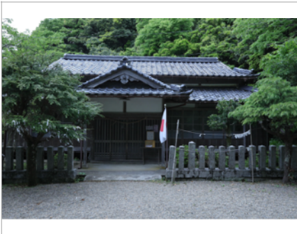
竹野神社 社務所、写真：森川昇 Takano Shrine, shrine office, Photo: Noboru Morikawa