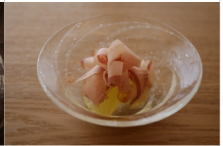
桃のおひたし（縄屋）、写真：森川昇 | Peach in broth (Nawaya), Photo: Noboru Morikawa