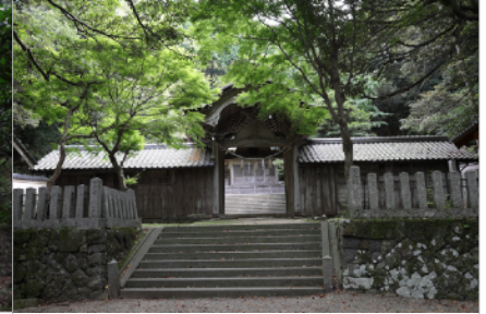
竹野神社、写真：森川昇 | Takano Shrine, Photo: Noboru Morikawa