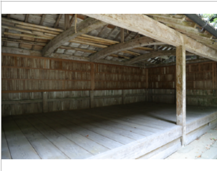
竹野神社 絵馬殿、写真：森川昇 | Takano Shrine, hall for votive pictures Photo: Noboru Morikawa