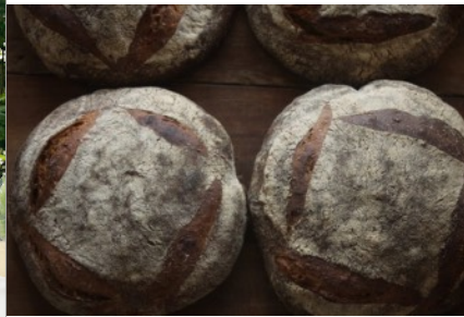
薪窯焼成のパン（弥栄窯） | Kiln-baked bread (yasakagama)