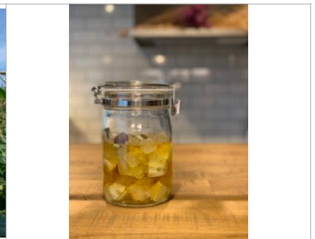
クラフトビネガー作り（飯尾醸造） | Craft vinegar making workshop (Iio Brewery)