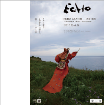
ECHO あしたの畑一丹後・城崎、写真： 森川昇 | ECHO Food and art event 2022, TOMORROW FIELD, Photo: Noboru Morikawa