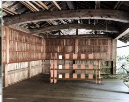
ライブラリー構想イメージ（BACH） | Drawing for Library (BACH)