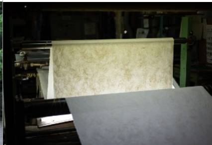
間人紙の制作風景 写真：田中義久 Production of Taiza paper, Photo: Yoshihisa Tanaka