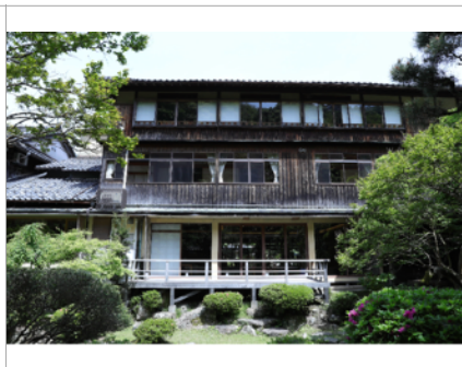
城崎温泉三木屋 | Kinosaki Onsen Mikiya