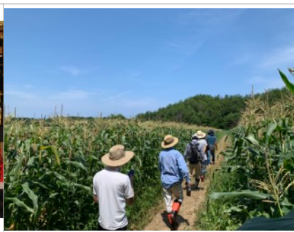
オーガニック野菜の収穫体験（てんとうむしばたけ） | Harvesting Organic Vegetables (Tentoumushi Batake)