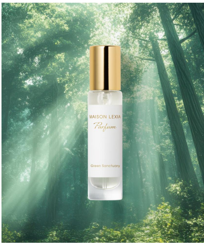
【オードパルファム】グリーン サンクチュアリ 10mL 5,500円(税込)

そしてメゾンレクシアは2025年10月1日(水)、木々と草葉が響き合う、深緑の森をイメージした 限定フレグランス「グリーン サンクチュアリ」を数量限定で新発売いたします。