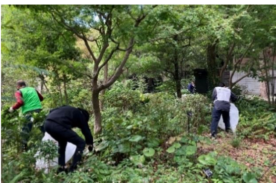
月に1回紀尾井タワーオフィステナントと共に美化活動を実施