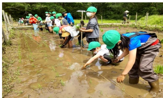
地元小学生が総合学習の一環で田植えを実施。