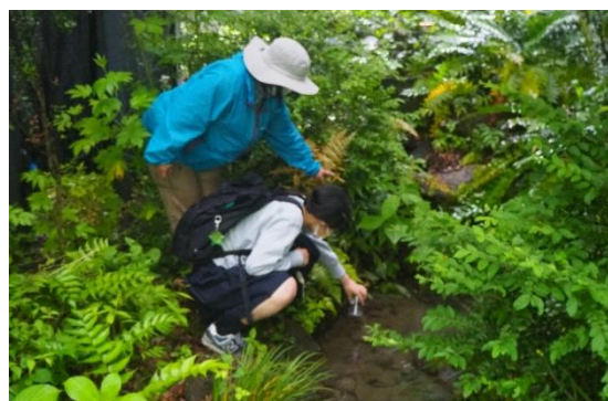
近隣の麴町中学校理科サークルの生徒とホテルの幼虫、カワニナ放流