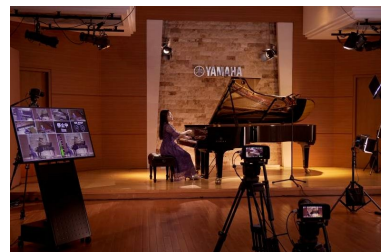
5台のカメラを使用し、 マルチアングルで撮影