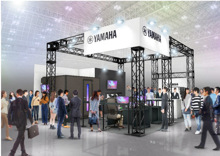
ヤマハブース（イメージ）

株式会社ヤマハミュージックジャパンは、2023年9月21日（木）から24日（日）まで幕張メッセ（千葉県美浜区）で開催される「東京ゲームショウ 2023」に出展し、ゲーム配信機器や防音室の展示、プレゼントキャンペーンなどを行います。