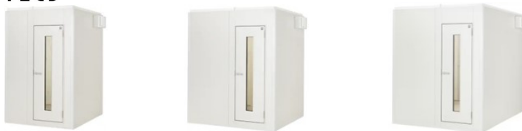
ヤマハ 防音室「AVITECS CEFINE NS（アビテックス セフィーネ NS）」 写真左から、1.5 畳、2.0 畳、3.0 畳