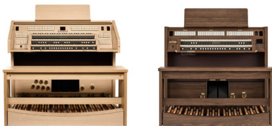
バイカント クラシックオルガン 『Sonare 65（ライトオーク）』 『Sonare 40（ダークオーク）』

※2 「Sonare」は日本国内におけるシリーズ名です。バイカント社のイタリアでのシリーズ名は「Maestro」です。