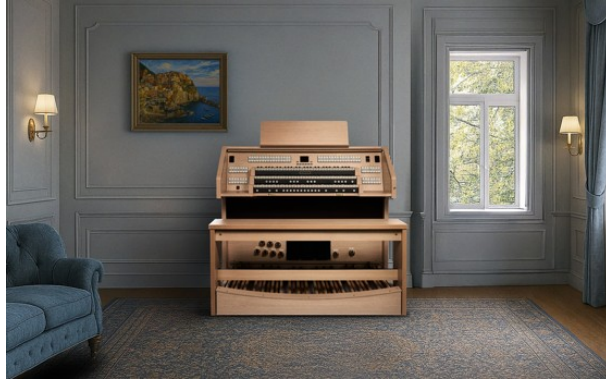
バイカウント クラシックオルガン設置イメージ

https://brands.yamahamusicjapan.co.jp/products/viscount/contents/organ_show_room#001