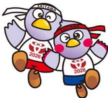
コバトン&さいたまっち