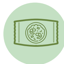
加工米飯 (冷凍チャーハン等)

❗ 飲食業、弁当製造業、惣菜製造業及びこれらに類する事業者は、本事業の補助対象とはなりません。