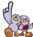
埼玉県のマスコット「コバトン」「さいたまもち」