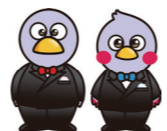
コバトン・さいたまっち