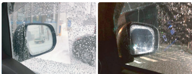
車のサイドミラーと窓 (左：昼／右：夜)