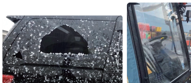
左：車のリアウィンド／右：フォークリフトのフロントガラス