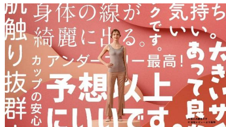
「ユーザーボイス篇」15秒