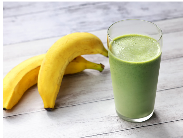
ジュースにして1日のスタートに。 毎日手軽に食べられる簡単栄養食 バナナジュース、パイナップルスムージー