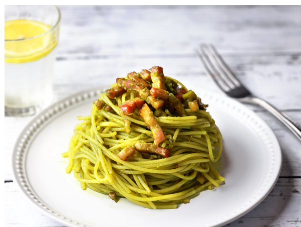
ジェノベーゼ風パスタ