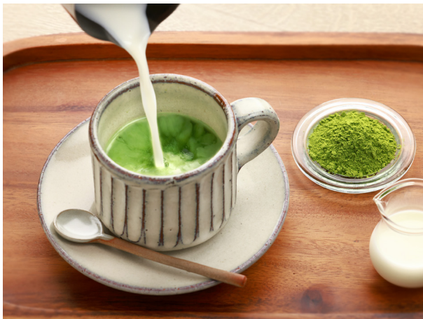
普段の飲み物に加えて・・・ミルクと一緒に