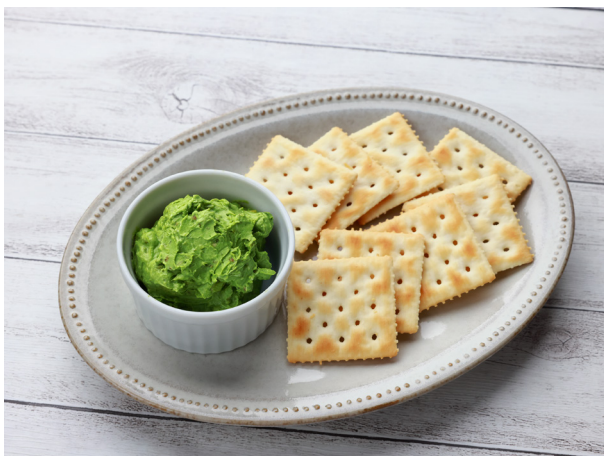
おやつにモリンガをプラスしてヘルシーに パンケーキ、ディップ