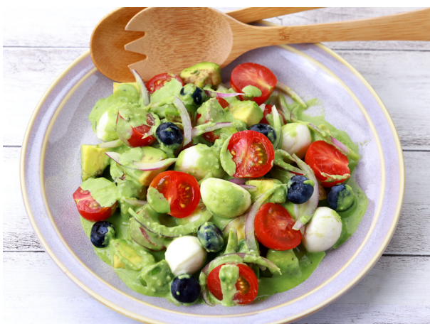
ランチや夕食にも・・・サラダドレッシング