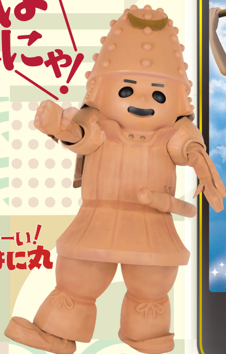
歴史ARラリー イメージキャラクター はに丸