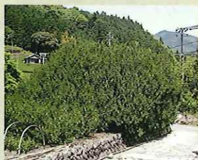
日本一の大茶樹 藤枝市大久保