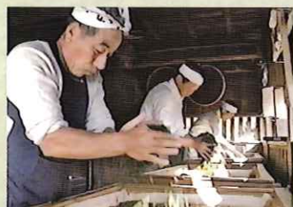
手揉み茶づくりと古民家 (藤枝市手揉み保存会)