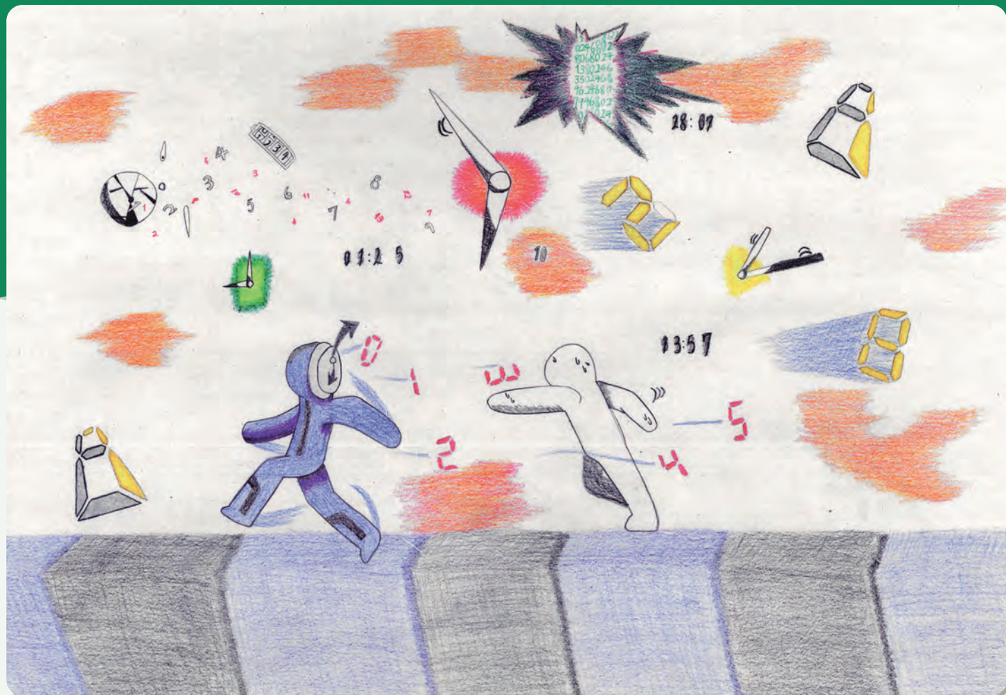
濱 大生 作「時間に追われる人」