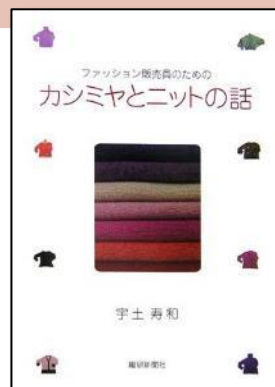
織研新聞社より カシミアニットの専門書を執筆