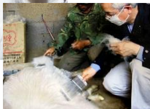
2008年内モンゴル カシミヤ視察 最高級のカシミヤで世界一の 製品作りを。