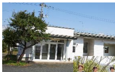
2011年より 岩手県北上市の 自社工場で生産開始

北上市のふるさと納税返礼品の提案を受け、以後、通算17億円の売り上げを計上。2023年からは英国の超名門店「ハンツマン」での取り扱いを皮切りに、海外へと事業展開を図っている。