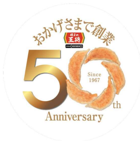
創業50周年ロゴマーク