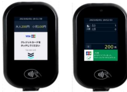
<専用リーダー（イメージ）>

お手持ちのタッチ決済対応のカード（クレジット・デビット・プリペイド）や、同カードが設定されたスマートフォン等を、専用リーダーにタッチすることで、そのまま乗車（降車）いただけます。