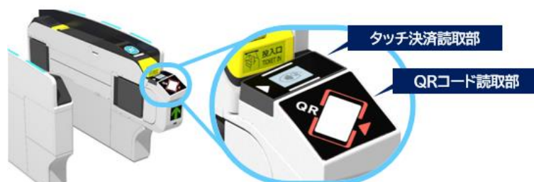
<自動改札機のイメージ>