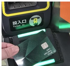
入場時に専用リーダーにかざす

タッチ決済に対応のカード(クレジットカード・デビット・プリペイド)や、同カードが設定されたスマートフォン等を自動改札機に設置された専用のリーダーにかざすことで、地下鉄にご乗車いただくことができます。