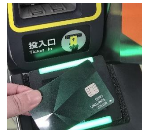
出場時に専用リーダーにかざす