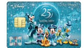
東京ディズニーシー®25周年記念カード (期間限定)