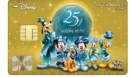
東京ディズニーシー®25周年記念カード (期間限定)