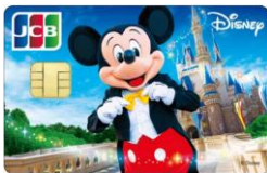
ミッキー・マウス(キャッスル)