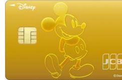
ミッキー・マウス (モバ即限定)*