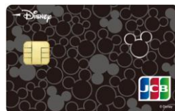
ミッキー・マウス(ブラック)