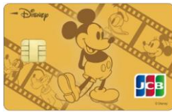
ミッキー・マウス & フレンズ