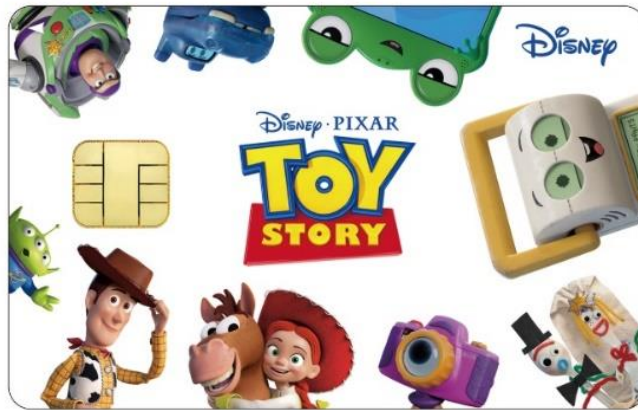
「トイ・ストーリー」新デザイン