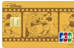
蒸気船ウィリー(ゴールド)