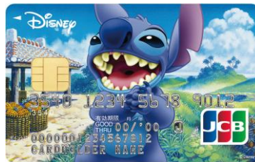
スティッチ (アイランド)