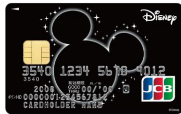
ミッキーマウス (ブラック)