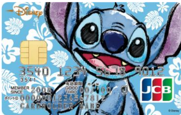
スティッチ (ハイビスカス)