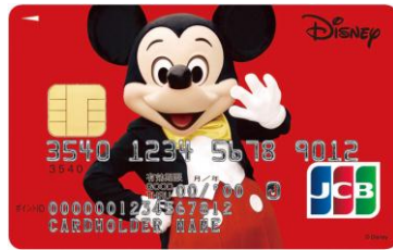
ミッキーマウス (レッド)