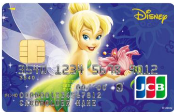
ティンカー・ベル