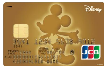
ミッキーマウス (ゴールド)