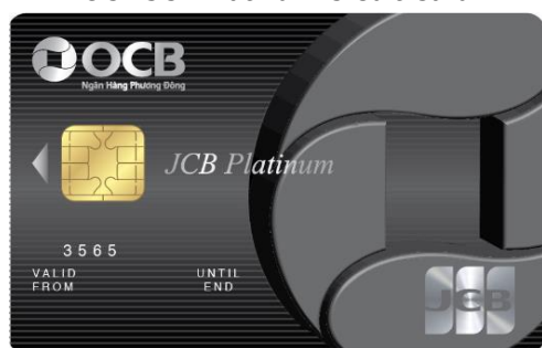
OCB-JCB Platinum Credit Card