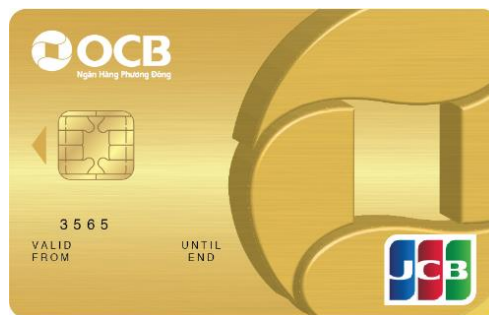
OCB-JCB Gold Credit Card