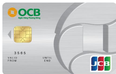
OCB-JCB Standard Credit Card