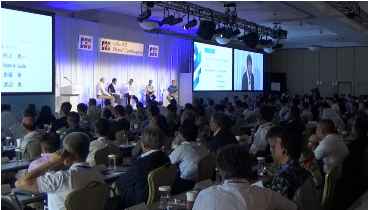
テーマセッション(トヨタモビリティサービス株式会社、IDEMIA、富士通株式会社、株式会社ジェーシービー)