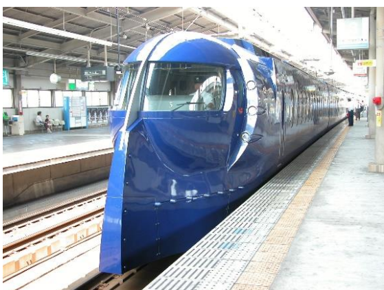
空港特急ラピート

JCBと南海電鉄は、今後も連携してさらなるインバウンド旅客数増加、観光消費拡大、地域活性化につながるキャンペーンを検討・実施していきます。