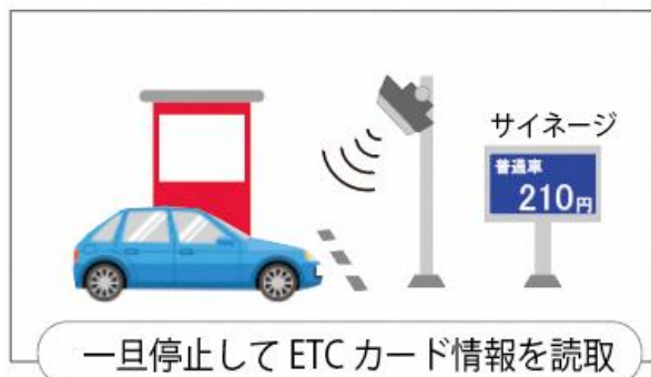
E T C 読取イメージ

■本件に関するお問い合わせ先 ※別紙3「社会実験における実施体制」をご参照ください。