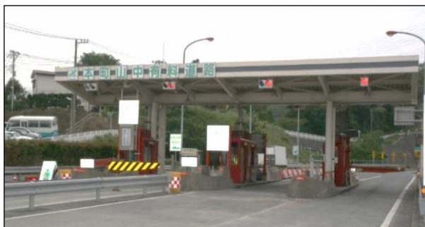
本町山中有料道路