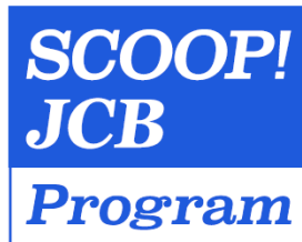
<SCOOP! JCB Program ロゴ>

ブランドキャンペーンとは、JCB ブランドのカード（JCB のロゴがついている、カード番号が 35 から始まるカード）をお持ちのすべての会員様を対象としたおトクなキャンペーンです。このような活動を通して、お客様に選ばれるカードブランドを目指してまいります。