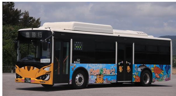
(世界自然遺産ラッピングバス)

西表島交通が運行する路線バスは、世界自然遺産に登録されている西表島の北西部の白浜と東南部の豊原の間を結ぶ路線バスで日本最南端を運行しています。西表島は年間約 30 万人の観光客が来訪する島であり、今般、西表島交通の路線バスが国際ブランドのタッチ決済に対応することにより、カードやスマートフォン等を読み取端末にかざすだけでバスに乗車可能となるため、観光客や地元のお客さまの利便性向上が図られます。