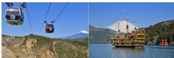
国際ブランドのタッチ決済を導入する 箱根ロープウェイ・箱根海賊船