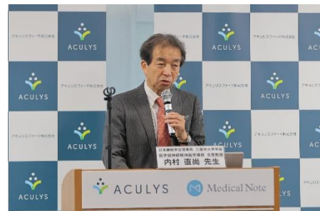
共催メディアセミナーでご講演される