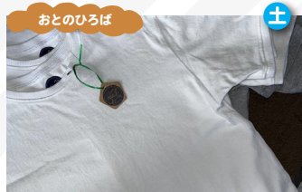
Jiji Tシャツ、オーダーシャツギフト券等