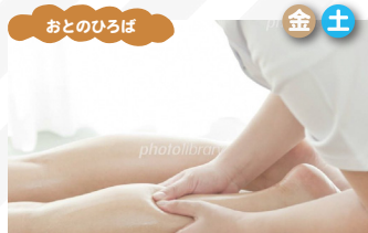
むくみケアサロン Camomille ハンドマッサージ、ヘッドケア等