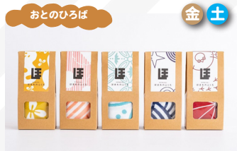
ほまれや デザイン前掛け、伝統柄あずま袋