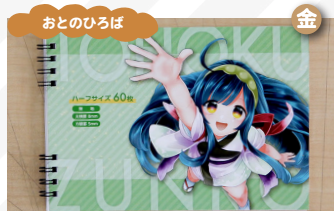
トーユー 「東北ずん子」ノート、マスク等の雑貨