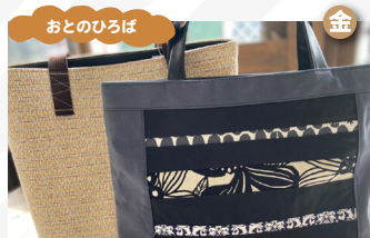
杜の工房 刺繍のポーチ、バッグ