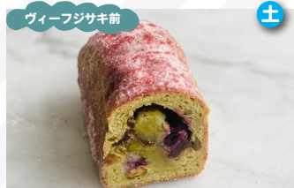
ALO bake 焼き菓子、カヌレ、シュトーレン