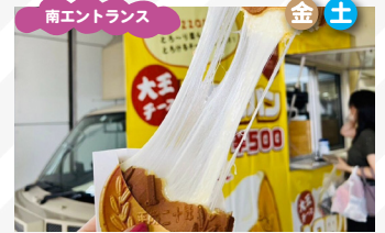
大王チーズ10円パン 大王チーズ 10円パン