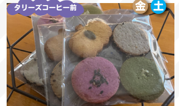
Loupe キャロットケーキ、野菜フィナンシェ