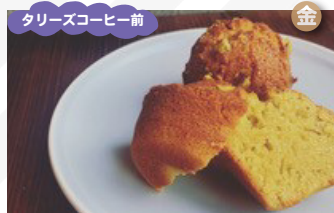
パティスリーサガエサン 寒河江産素材を使ったスイーツ