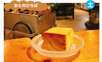
虹色路店 台湾カステラ