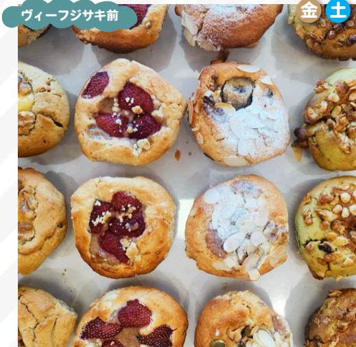
ディリーズマフィン マフィン、スコーン