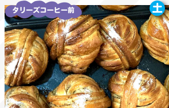
デンマーク料理専門店 nordic パン、シュトーレン、アクセサリー