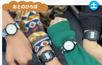
GOTO TOKEI オリジナルデザインウォッチ、バンドデザイン体験