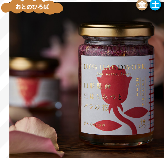
ひんのおのや ジャム、はちみつ、ティーギフト