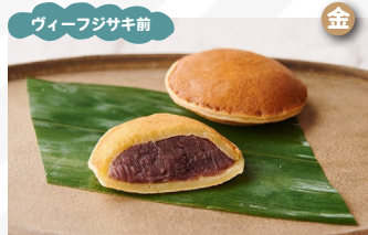
まるごと どらやき、シフォンケーキ