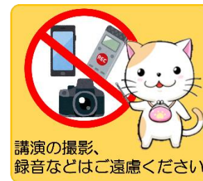
当法人のマスコットキャラクター ゆきち