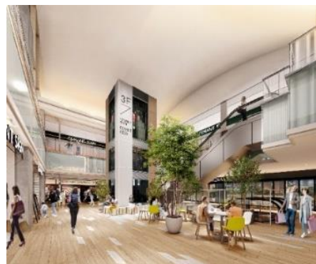
二番館 2階センターコート