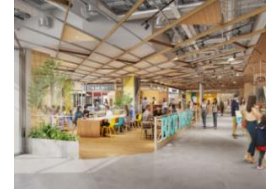
一番館 1階フードコート