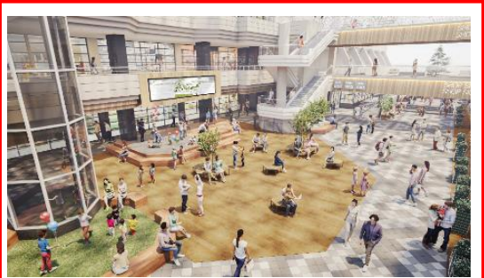
一番館 アトリウムコート