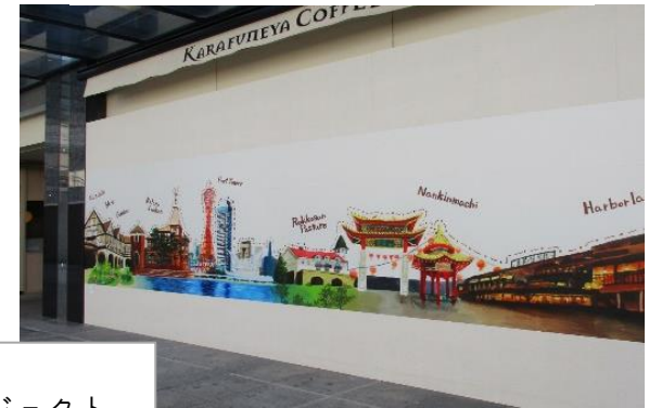
第1弾 パネルアート・プロジェクト