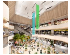
一番館 1階センターコート