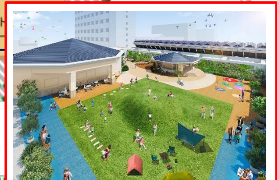
一番館 4階屋上あそび場