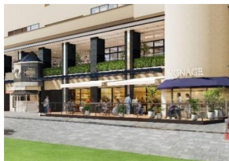
二番館 1階テラス席