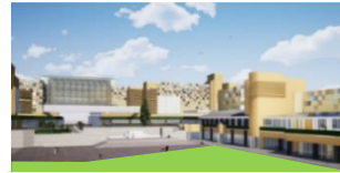
西神中央プレんティ外観