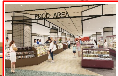
一番館 1階フードマルシェ