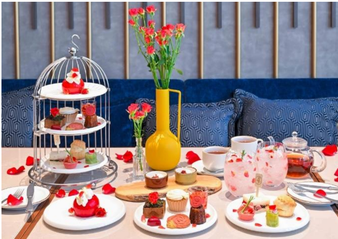
カフェ&バーで提供するアフタヌーンティー

カフェ&バー「LOKAL HOUSE」では、3段のスタンドで“バラ尽くし”のスイーツ7種とセイボリー4種をご提供いたします。