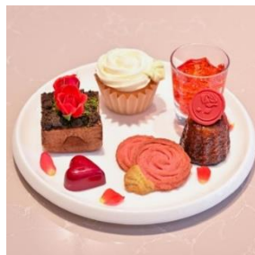
中段 バラがテーマのスイーツが並ぶ