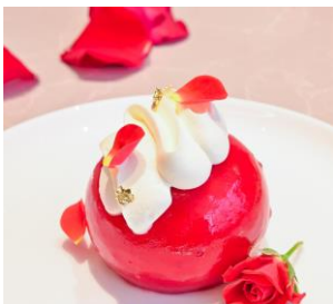
上段 バラの華やかさを表現したムース