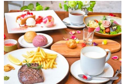
バラ尽くしのランチコース