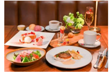
バラ尽くしのディナーコース

朝食は、和食の3段重、または洋食の卵料理からお選びいただけ、さらにbuffetボードからお好きなものをお好きなだけお召し上がりいただけるセレクションbuffetをご用意しています。