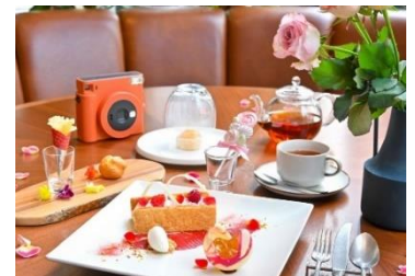
感謝の気持ちを伝える“母の日”