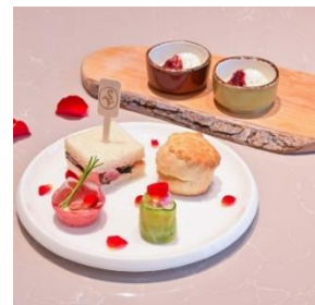
下段 バラや春の食材のセイボリー