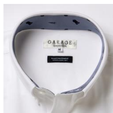
裾の20周年記念ネームと川崎フロンターレ仕様の衿裏