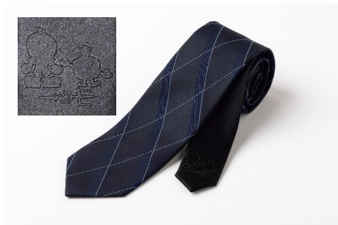
小剣には「ふろん太」「カブレラ」「ORIHICAの鍵マーク」のコラボデザイン