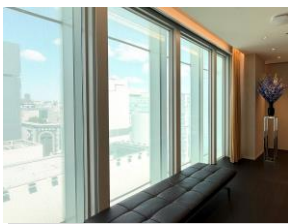
室内から外向を望む際に 自然な景色となる様子

ファサードに光を透過させるため、高解像度のオンデマンド印刷技術により、三次元曲げガラスの表面に色が異なる微小のドット柄を二層に印刷。これにより外側はメインテナントであるブランドのシンボルカラー、内側は白色とし、外観でのブランディングと室内からの自然光の視認性を両立させました。また、BIMにより約2800枚のガラスを統合管理し、垂直水平のドットグラデーションを完成させました。