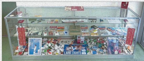
常設展示の様子(秋田市民市場)