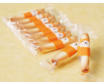
※360度ぐるっとハチ公のデザイン

ヨックモックの“ハチ公”缶は2023年8月に誕生しました。当時、ハチ公の生誕100年を記念して一部店舗で販売した本商品※は、「世界中で愛されるハチ公のように、お菓子を通じて人と人とのつながりを創り、永く愛されるブランドでありたい」というヨックモックの想いが込められています。