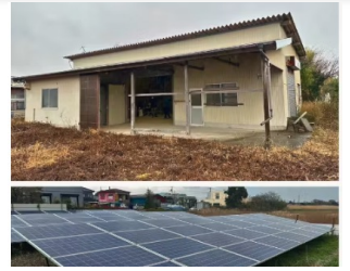
千葉県木更津市の空き倉庫を活用する太陽光発電 × アクアポニックス (木更津モデル)

私たちは、地球環境と人の健康を一体として考えることが大事だと考えています。地球環境を健康にするためにアクアポニックスを運用し、その成果物で人も健康にする、いわば地球と人を健康にする“まちづくり”をしていきたいと思っています。このような未来を実現するため、クラウドファンディングに挑戦します。