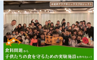
食料問題から子供たちの食を守るための実験施設を作りたい！