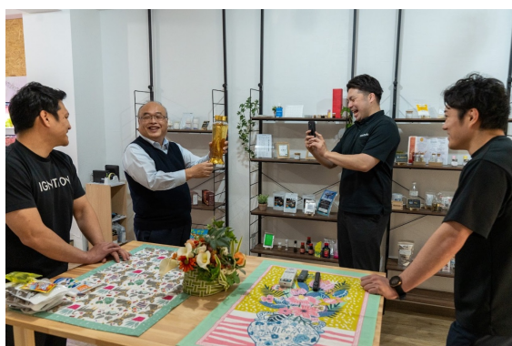
IGNITIONメンバー、JFR 宮崎社長 (中央 左) アクアポニックスで収穫された高麗人参を手にする宮崎社長