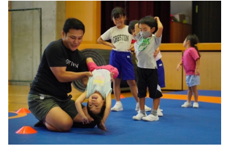
IGNITION 代表とレッスン中の子どもたち