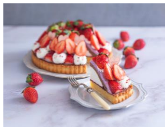
【3F】ラ・メゾン アンソレイユテーブル

看板メニューの「あいがけカレー」を2周年仕様でラインナップ。オリジナルカレーとご当地カレーの2種を一度に楽しめます。ご当地カレーは週替わりで登場し、さまざまな地域の味に出会えるのも魅力的です。