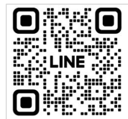
中日ビル公式LINEQRコード