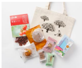
【1F】おかしな大地 from farm to spoon by Enakawakamiya

愛知県産イチゴ「ゆめのか」を使用。華やかな香りと、甘みと酸味のバランスがはっきりとした味わいが特長です。なめらかなカシスフロマージュクリームとカシスジャムを合わせ、甘酸っぱいハーモニーが楽しめる春らしいタルトです。