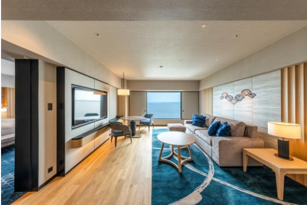
デラックススイート リビングルーム