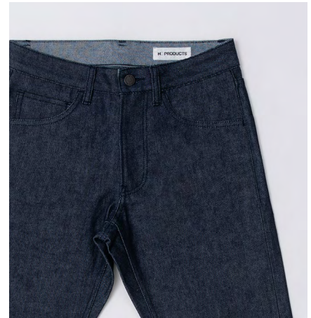
自社のオリジナルブランドNC PRODUCTSのベーシックパンツ。自社で発生する裁断くずを利用した再生生地を使用。パターンや縫製はノウハウを存分に活かし、社員の技術向上の一端を担っている。

実を言うと、すでにあった就業規則を整理したという印象です。あらためて、労務士、税理士、行政書士らと労務基準や社会保険などを見直し、整合性を確認しました。結果的に大きく内容も変わることなく、確認作業を通じてこれまでの規約が間違いではなかったという自信も得られました。一方、感覚的な認識であった温室効果ガスや水資源の使用削減などの環境基準を明文化しています。さらにパワーハラスメント、妊娠出産へのハラスメント、セクシャルハラスメントの三つのみを禁じていたハラスメントの項目に具体性を持たせ、身体や精神の健康を損なった場合に雇用をどのように守るかといった内容まで踏み込んで規則を加筆修正、アップデートしています。そして労働災害が起こったときの状況分析、改善点の取り組み、事故の再発防止などのフローを明文化したことで、従業員に会社のあり方を伝えやすくなりました。どうしても制度策定はトップダウンにならざるを得ない面もあります。しかし会社に合ったものを詰めていく段階で従業員から意見を吸い上げていく過程が必要です。今回の取得過程が従業員との相互理解を深めることに繋がり、会社の環境改善にも繋がりました。