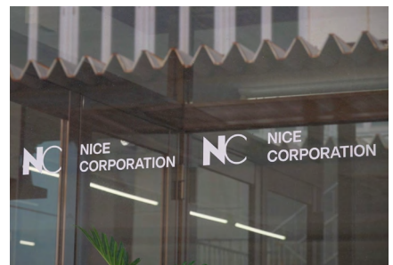
児島にある本社工場のエントランス