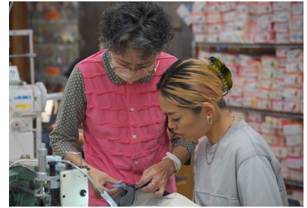
日々の業務を通じ、具体的な技術継承を実践する。

B Corp™の取得自体が目的ではなく、あくまで従業員が離れない会社づくりが目的です。従業員が離れる原因は、彼らに何かしら不満があることがほとんど。それは単純に給料面や待遇面に限らず、居心地の良さも求められます。弊社はここ数年ほとんど人が辞めておらず、従業員の世代も若い世代からベテランまで幅広い。私たちの業界は仕事に飽きて辞めてしまう人も少なくはありませんから、刺激的な目標とそれによる達成感を得つつ、最終的には賃金に還元されていかなくてはなりません。今後は社員との共有がより重要になるでしょう。会社の業績説明とともに取得の進捗についても逐次報告していきます。