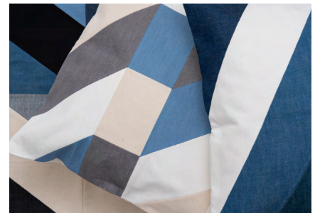
NC PRODUCTSから発表した、残反をパッチワークしたクッションとラグ。角の部分にズレが出ない縫製も、同社が誇る技術力の高さを表現している。