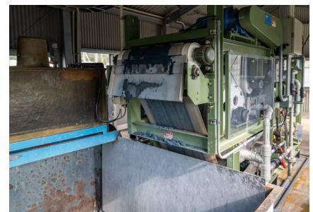
縫製後に後加工を行う関連工場（ニッセンファクトリー株式会社）では、徹底した排水処理が行われている。自社内に限らず、関連工場と連携し、相互理解を深める活動も実践している。

インタビュー・文：山田泰巨