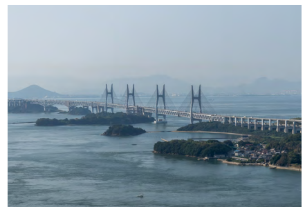
本社工場は瀬戸大橋の程近くに。 この地域では昔から綿花栽培が盛んであった。

1979年生まれ。高校卒業後にカナダバンクーバーに留学し、現地のヴィンテージショップなどで経験を積み2003年に帰国。ナイスコーポレーション入社後、20年間あらゆる現場を担当する。2021年代表取締役に就任し、工場の可能性を伝えるため世界中を飛び回る日々。