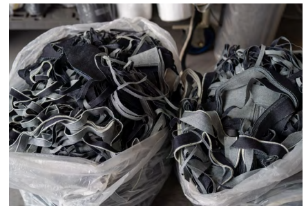
裁断くずをはじめとする廃棄物は日々計量が行われ、削減目標を具体化。写真の裁断くずは、先述の自社ブランドの生地として再生される。