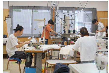
B Corp™認証を目指す活動は、Z世代をはじめとする若い世代の入社にも繋がっている。