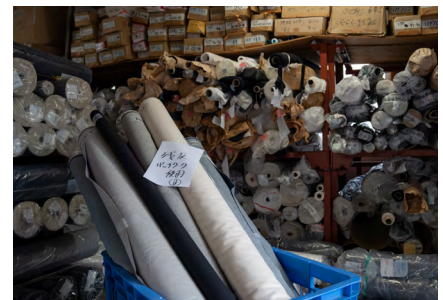
製造過程において発生してしまう残反。この中から自社ブランドに生地を活用する。