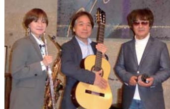
Yoshi's ボサノヴァ・トリオ