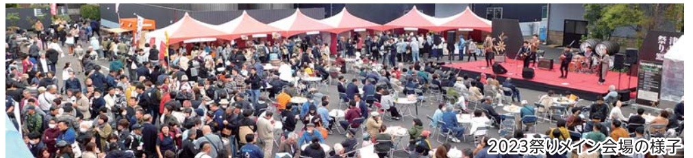
2023祭りメイン会場の様子