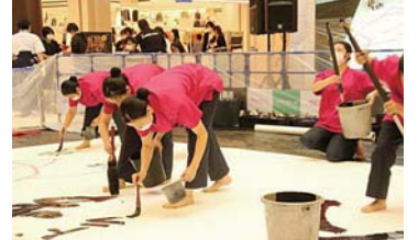
鳳凰高等学校書道部 書道パフォーマンス