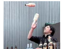
フレアバーテンディング