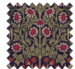
ブラックソーン ダムソン