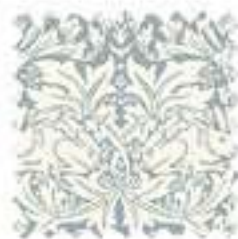
ブラザーラビット ブルーグレイ