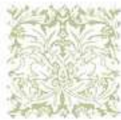
ブラザーラビットアロエ