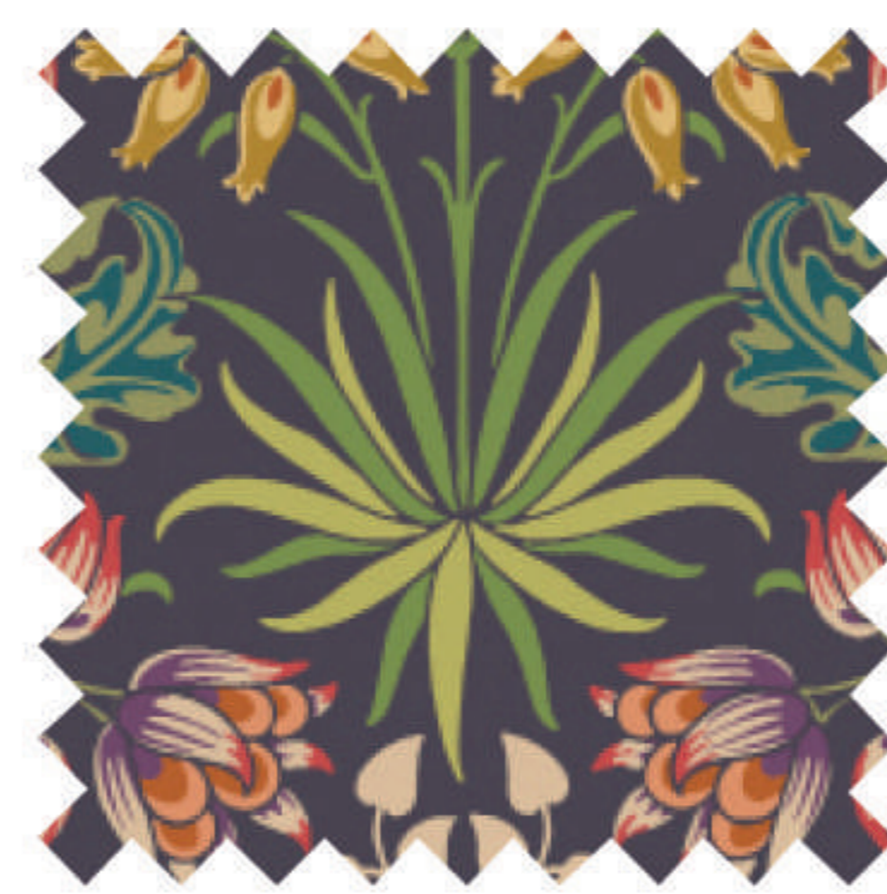
ヒヤシンス プラム