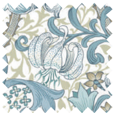
ゴールデンリリー パウダーブルー