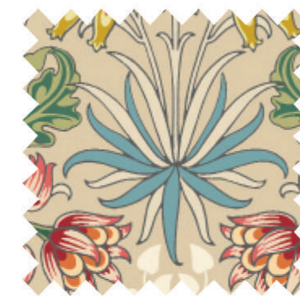
ヒヤシンス ナチュラル