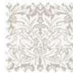
ブラザーラビット パーチメント