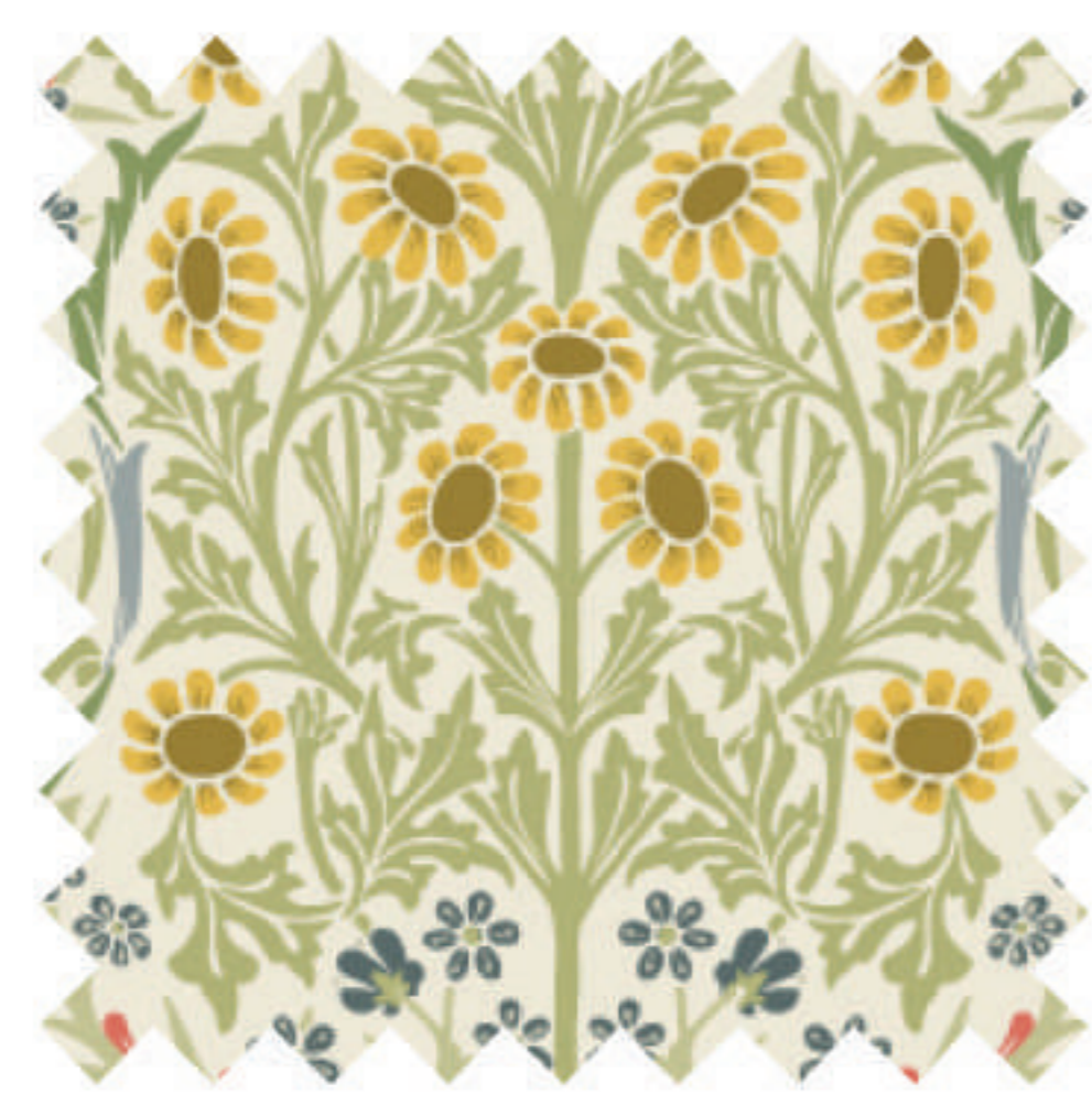
ブラックソーン スプリングメドウ