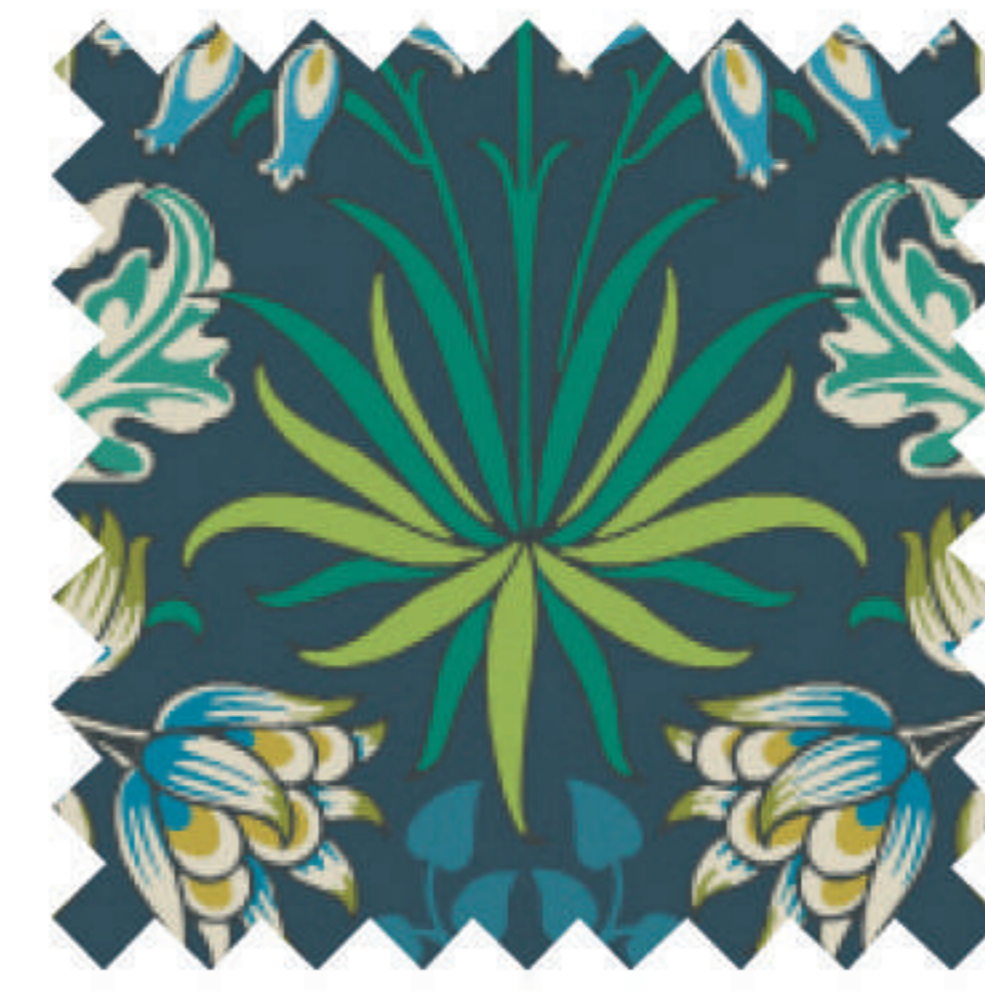
ヒヤシンス エメラルド