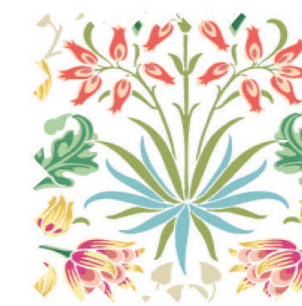
ヒヤシンス スプリングブルーム