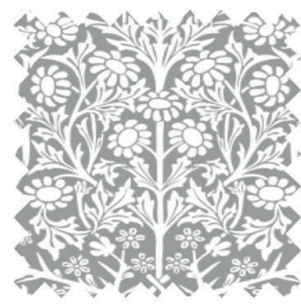
ブラックソーン ストーン