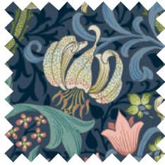
ゴールデンリリー トワイライト