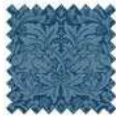
ブラザーラビットエーゲ