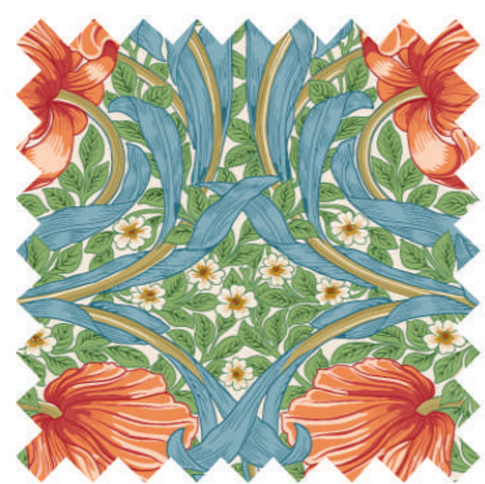
ピンパーネル クレメンタイン