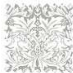
ブラザーラビット ストーン