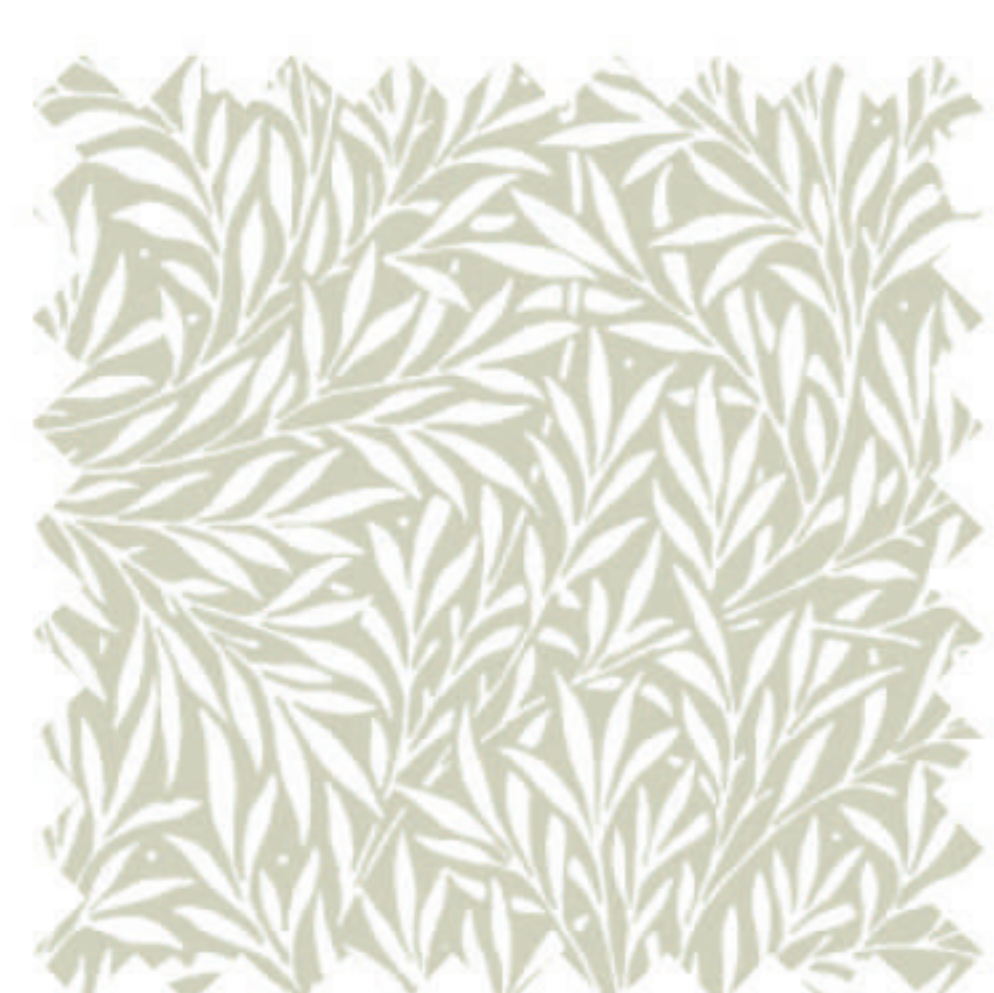
ウィロー ポーセリン