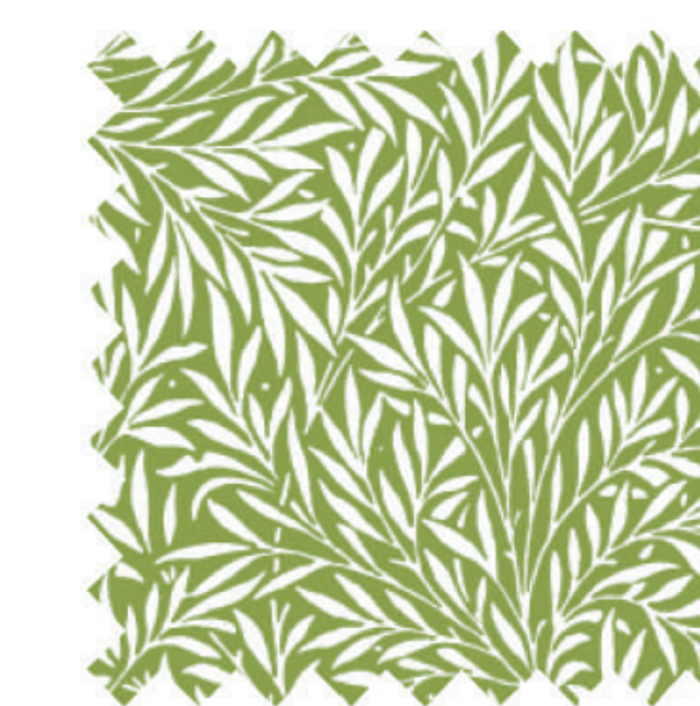
ウィロー オリーブ