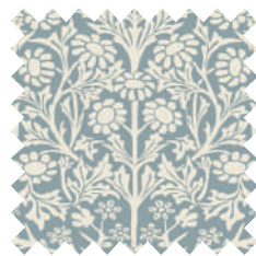
ブラックソーン ブルーグレー