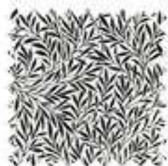
ワイローオニキス