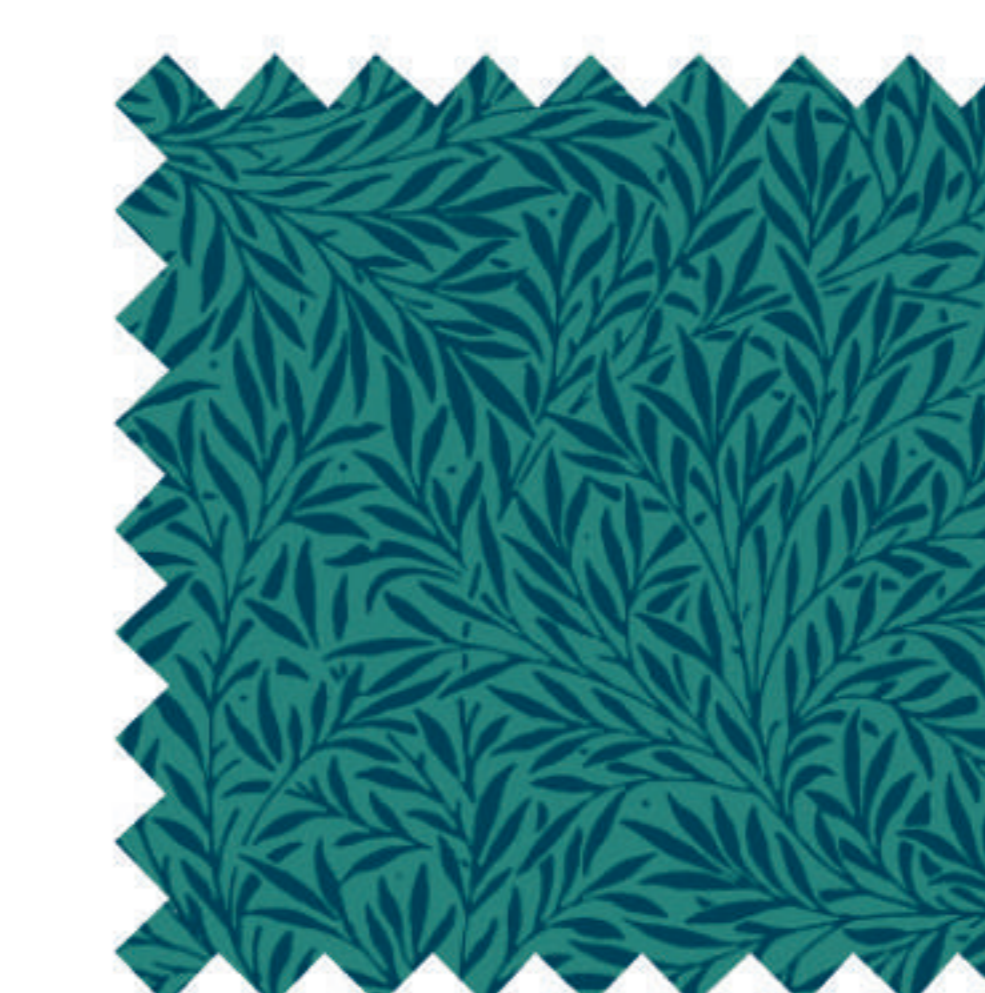
ウィロー ジェイド