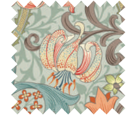
ゴールデンリリー コーラル