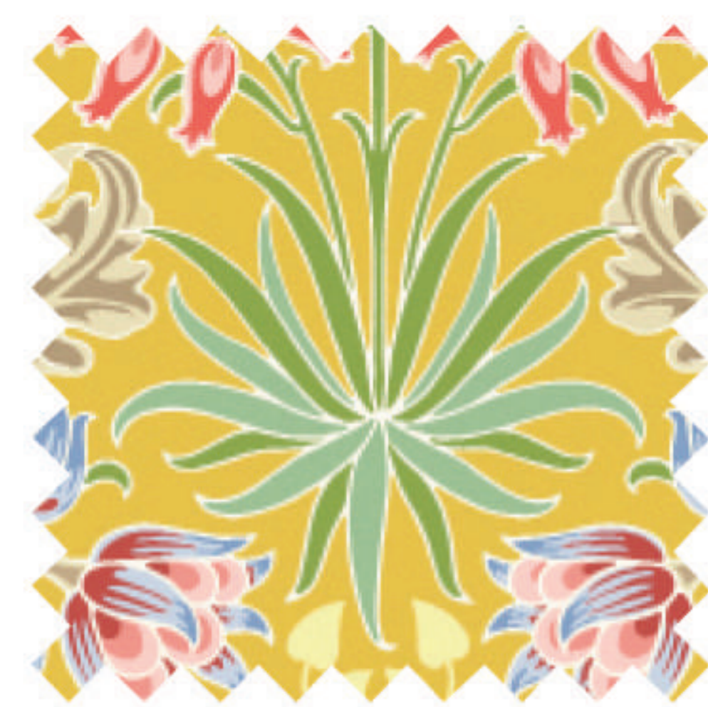
ヒヤシンス サフラン