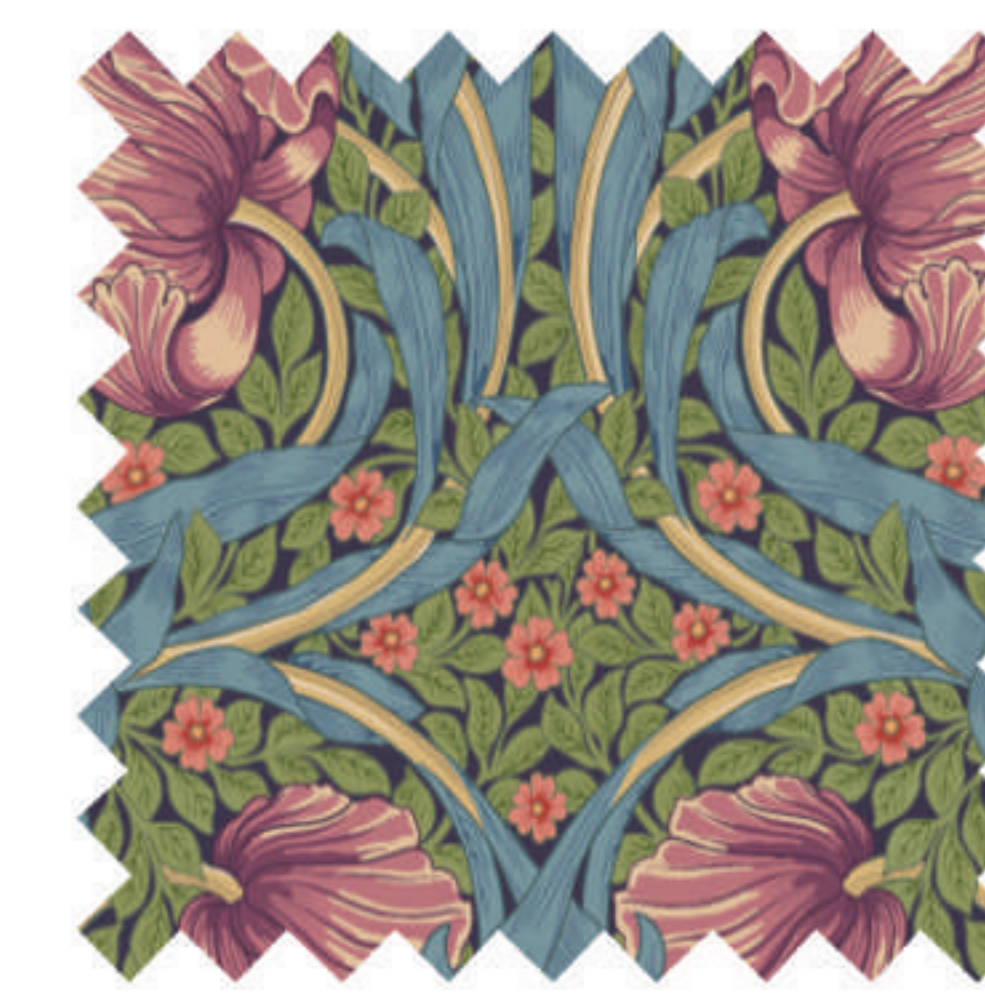
ピンパーネル エルダーベリー