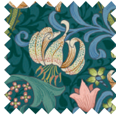
ゴールデンリリー エバーグリーン