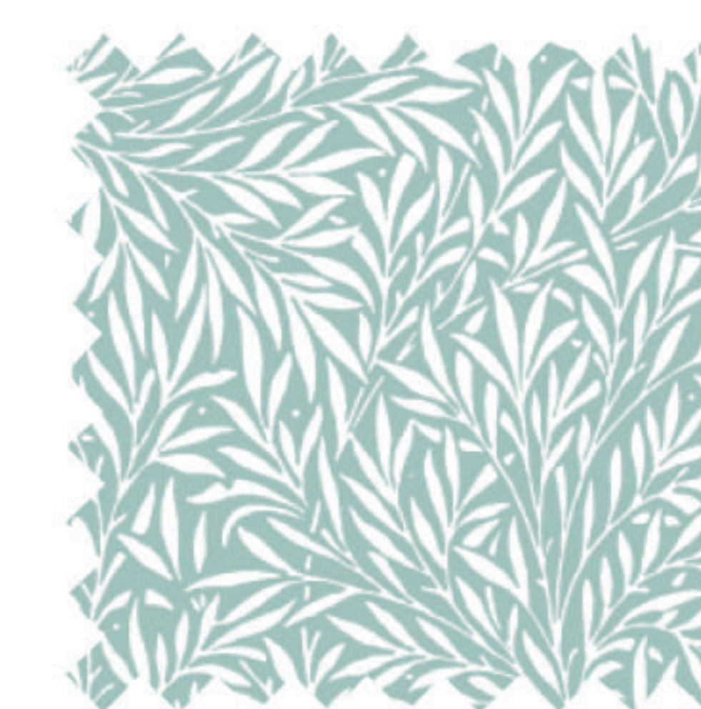
ウィロー ダックエッグ