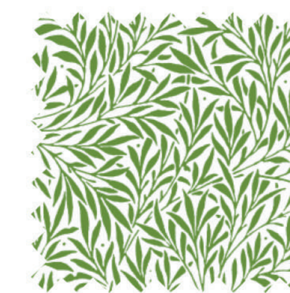
ウィロー クローバー