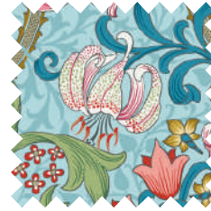
ゴールデンリリー ファンタジー