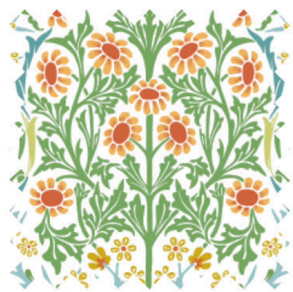
ブラックソーン サマーガーデン