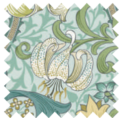
ゴールデンリリー オパール