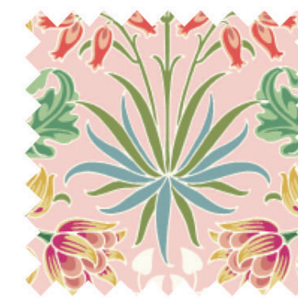
ヒヤシンス シャーベット