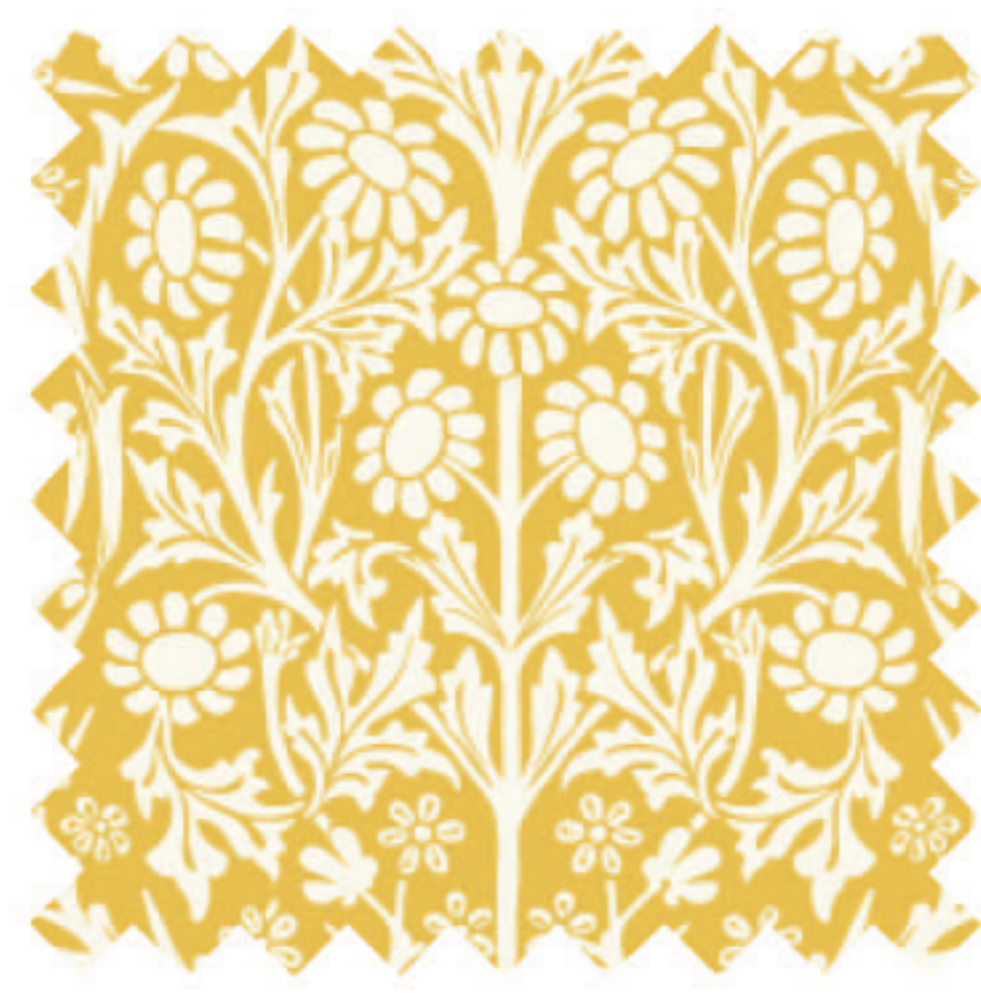
ブラックソーン サフラン