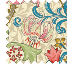
ゴールデンリリー エデン