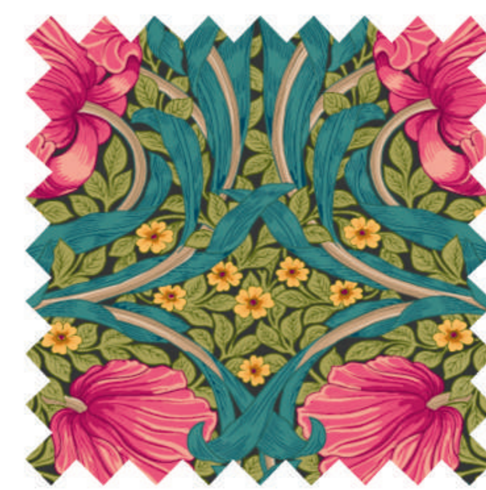
ピンパーネル マゼンタ