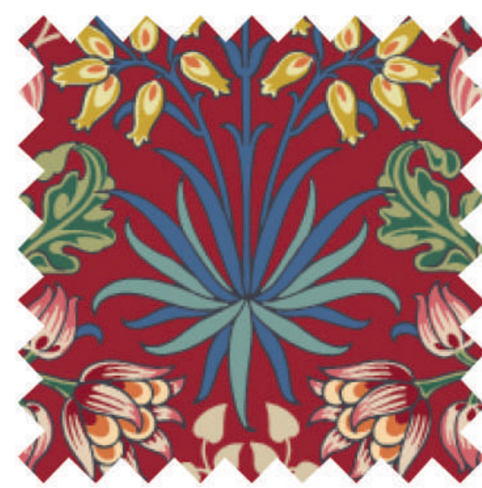
ヒヤシンス ラセット