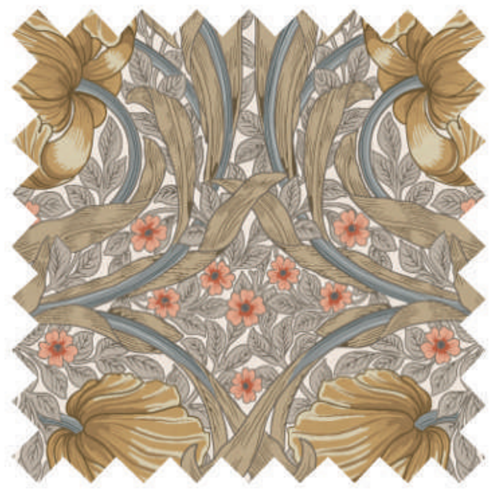
ピンパーネル バタースコッチ