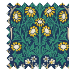
ブラックソーン インディゴ