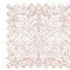
ブラザーラビット ソフトピンク