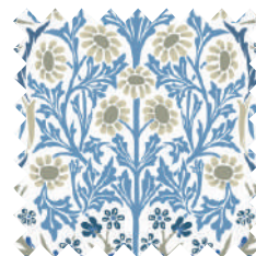
ブラックソーン チャイナブルー