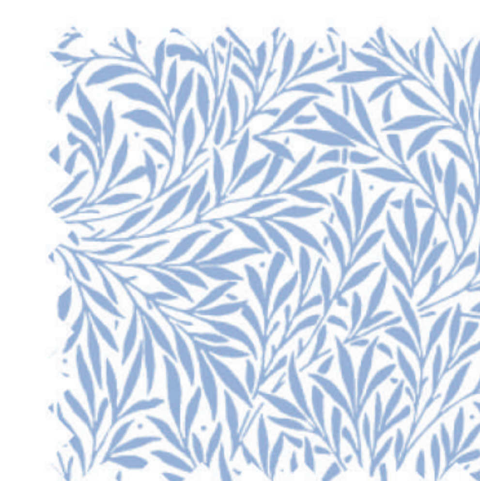
ウィロー コーンフラワー