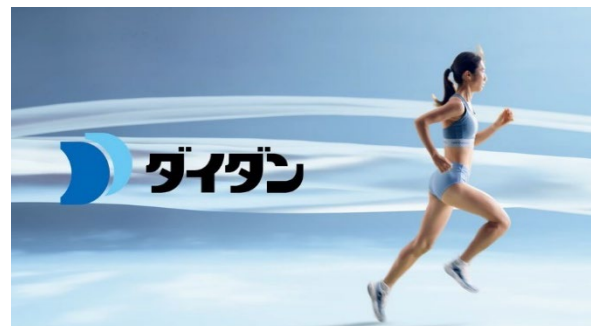
ダイダン株式会社CM「整え、挑む」篇