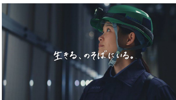
ダイダン株式会社CM 「生きる、のそばにいる。」 篇