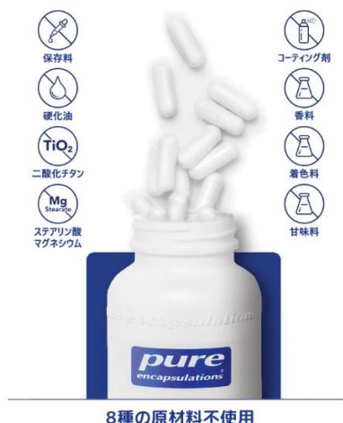
8種の原材料不使用

※2 医療専門家に最も推奨されるサプリメントブランド (アメリカ合衆国内におけるブランド調査) Nutritional Business Journal® 2016, 2020