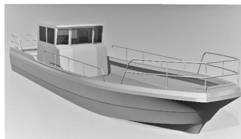
(完成イメージ 左：「つばき」後継船 右：「第一清港丸」後継船)

※電気推進船：従来のディーゼルエンジンを搭載した船と異なり、リチウムイオン電池を電源とし、推進電動機（モーター）で航行する船舶